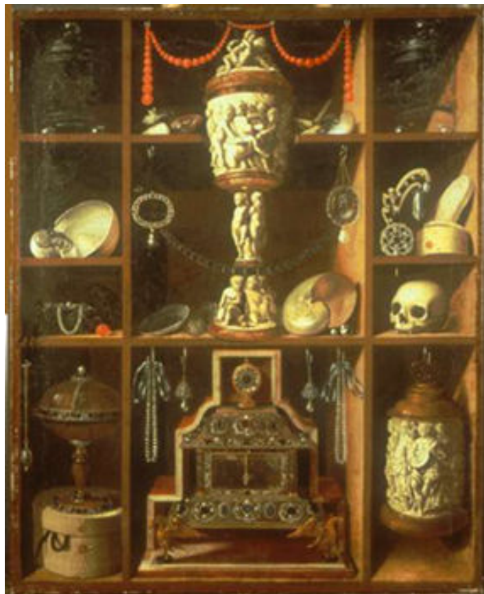
J.G. Heinz, Rariteitenkabinet

In veel verhalen is er sprake van piraten en geheime schatten die bestonden uit gebruiksvoorwerpen, wapens en kunst. Het gevolg was dat rijke mensen spullen gingen verzamelen en dat die spullen moesten worden opgeborgen of werden tentoongesteld. Uiteindelijk werden de verzamelingen van sommige mensen zo groot dat aan het eind van de 18e eeuw de eerste musea werden gebouwd.